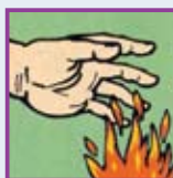
Tratamiento de Quemaduras