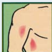
Suaviza la Piel Escamosa y Reseca