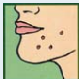
Elimina el Acne

Tamanu Oil™ actúa estimulando la cicatrización de la piel, y es potente protector del daño de la luz solar. Además humecta y suaviza la piel, tiene efectos antibióticos, analgésicos y antiinflamatorios. Algunos de ellos son: