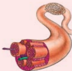
Proteje Los Nervios