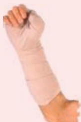
Reduce la Inflamación